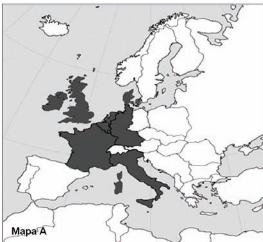
Mapa A. ....

Mapy przedstawiają proces rozwoju terytorialnego Unii (Wspólnot) Europejskiej. Do zamieszczonych map dobierz odpowiadające im tytuły. W wyznaczone miejsca wpisz właściwe numery.